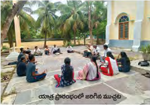
యాత్ర ప్రారంభంలో జరిగిన ముచ్చట

వాటి/ వారి ప్రాచుర్యానికి ఒక వేదిక కల్పించే ప్రయత్నం చేస్తుంది పల్లెసృజన. గ్రామీణ ఇన్నోవేషన్లను వెతికి పట్టుకొని, వాటిని సమాజానికి పనికి వచ్చే విధంగా తీర్చి దిద్ది, తద్వారా గ్రామీణాభివృద్ధికి మార్గాలు చూపించే పని చేస్తుంది పల్లెసృజన. దేశంలో ప్రత్యేకించి తెలుగు రాష్ట్రాల లోని గ్రామీణ ప్రాంతాలలో వున్న ఇన్నోవేషన్లను, సాంప్రదాయ జ్ఞానాన్ని శోధించటానికి ప్రతి మూడు నెలలకు ఒకసారి పల్లెసృజన చేపట్టే అతి ముఖ్య కార్యక్రమం ఈ 'చిన్న శోధయాత్ర'.