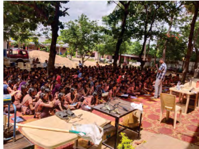
4 ఆగస్టు, 2023న తెలంగాణ రాష్ట్రం లోని సిరిసిల్ల జిల్లా, బొప్పాపూర్, జిల్లా పరిషత్ ఉన్నత పాఠశాలలో సుమారు 450 మంది విద్యార్థులకు ఇన్నోవేషన్ల మీద అవగాహన సదస్సు నిర్వహించి, గ్రాన్ రూట్స్ ఇన్నోవేషన్ల మీద అవగాహన కల్పించడం జరిగింది.