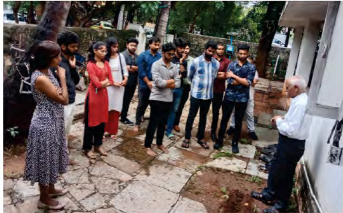
జూలై 25న టిఎన్ఐసి బృందం 'పల్లెసృజన' ఇన్నోవేషన్ల విస్తరణ కేంద్రాన్ని సందర్శించింది. ఈ సందర్భంగా 'పల్లెసృజన' వ్యవస్థాపక అధ్యక్షులు, ఇన్నోవేషన్లను గురించి వారికి వివరిస్తున్న దృశ్యం.