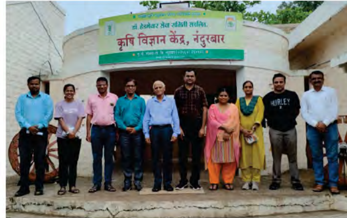
16 జూలై, 2023న 'పల్లెసృజన' బృందం మహారాష్ట్ర లోని కెవికె, నందమూర్ ను వారి ఆహ్వానం మేరకు సందర్శించి, వస్తున్న పునాది స్థాయి ఇన్నోవేషన్లు సమాజంలో తీసుకు రాగలిగే మార్పును గురించి చర్చించడం జరిగింది.