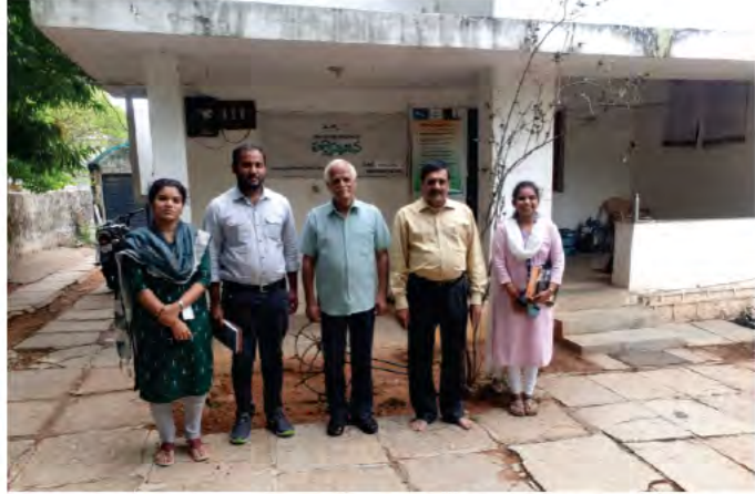
11 జూలై 2023న మల్లారెడ్డి స్కూల్ ఆఫ్ అగ్రికల్చరల్ కు చెందిన ప్రధాన ఆచార్యులు మరియు అధ్యాపకులు 'పల్లెసృజన' కార్యాలయాన్ని సందర్శించి పల్లెసృజన ద్వారా వెలుగులోకి వచ్చిన ఇన్నోవేషన్లు ఫలవంతంగా సమాజానికి అందటానికి తమవంతు కృషి చేస్తామని హామీ ఇవ్వటం జరిగింది.