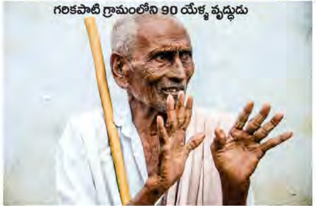
గలకపాటి గ్రామంలోని 90 యేళ్ళ వృద్ధుడు