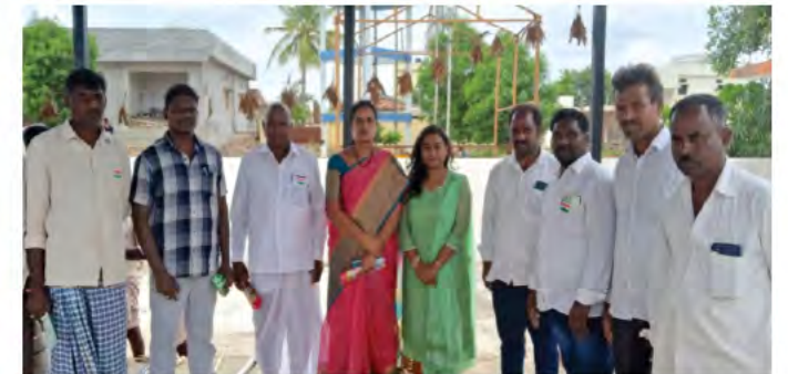
15 ఆగస్టు, 2023న తెలంగాణ రాష్ట్రం లోని రంగారెడ్డి జిల్లా, రావులపల్లి గ్రామంలో సిబిబి ఆధ్వర్యంలో ఒకరోజు రైతు సదస్సు జరిగింది. ఈ సందర్భంగా ఏర్పాటు చేసిన సదస్సులో ఏడుగురు ఇన్నోవేటర్లు, 25 ఇన్నోవేషన్లను ప్రదర్శించారు.