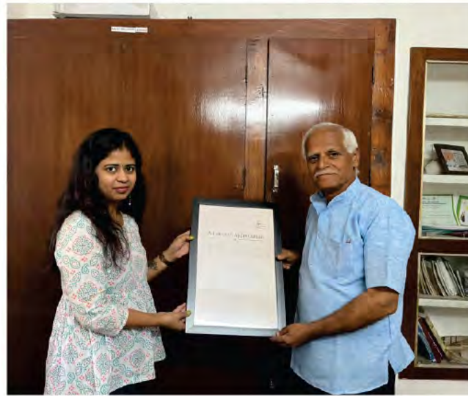
'గూంజీ' అనే జాతీయ స్థాయి స్వచ్ఛంద సంస్థ పల్లెసృజన కార్యాలయాన్ని సందర్శించి, సమాజంలో పునాది స్థాయి ఇన్నోవేషన్లు వెలుగులోకి తీసుకు వచ్చి, సమాజ అభివృద్ధికి కృషి చేస్తున్న 'పల్లెసృజన'ను అభినందిస్తూ జ్ఞాపికను బహుకరించిన దృశ్యం.