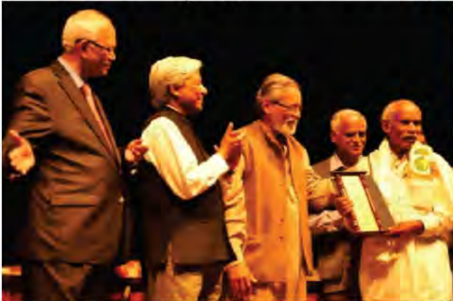
సృష్టి సమ్మాన్ - 2015

ఒక సామాన్య జీవి కనీసం 10వ తరగతి కూడా పూర్తి చేయ లేకపోయిన వ్యక్తి చుట్టాలు, తెలిసిన వాళ్ళ మధ్య హాస్యాస్పదమైన వ్యక్తి, చివరికి పిచ్చివాడు అనిపించుకున్న వ్యక్తి జాతీయ స్థాయిలో మన రాష్ట్ర అధ్యక్షుని ద్వారా “పద్మశ్రీ” పురస్కారం పొందితే ఆశ్చర్యం వేస్తుంది. అందులో ఆ వ్యక్తి మన తెలుగు వాడే అన్న సంగతి తెలిస్తే ఆనందం కలుగుతుంది.